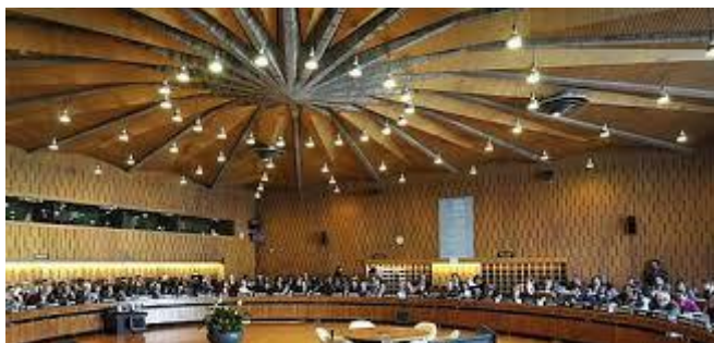
Täitevkoogu saal UNESCO peakorteris

Oma avasõnavõttus keskendus Eesti UNESCO eelarvele, kestlikele arengueesmärkidele, väljendusvabadusele ja ajakirjanike turvalisusele, haridusele, inimõigustele ja internetivabadusele. Täitevkoogu võttis taas vastu otsuse, milles kutsutakse UNESCOt üles järgima olukorda Krimmis UNESCO pädevusse kuuluvates valdkondades ning teavitama sellest liikmesriike. Eesti võttis sõna ka komisjonides (PX, FA, JOINT) erinevatel teemadel. SP komitee peamiseks teemaks oli peadirektori valimiste protseduuriga seotud temaatika. Täitevkoogu 197. istung peetakse 7.–21. oktoobril 2015.