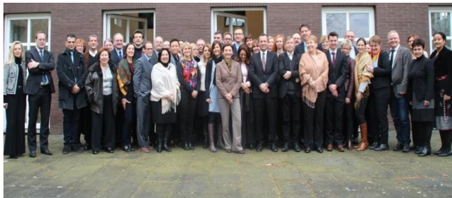
Bonni üritusel osalejad

2015. a veebruaris toimus Bonnisis Euroopa ja Põhja-Ameerika regiooni UNESCO rahvuslike komisjonide kohtumine, kus arutati mitmeid rahvuslikele komisjonidele olulisi teemasid, muu hulgas võimalusi võrgustiku koostöö tõhustamiseks. Ühe konkreetse väljundina otsustati luua uus veebileht http://european-natcoms.org/