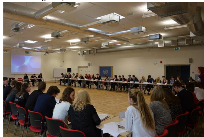
Arutelu simulatsioonil

ÜRO simulatsioon on Eesti UNESCO ühendkoolide võrgustiku üks ühistegevustest. UNESCO ühendkoolide võrgustik alustas tegevust 1953. aastal ning täna kuulub sellesse rohkem kui 9900 haridusasutust 180 riigist. Eesti võrgustikus on sel õppeaastal 21 kooli. Simulatsiooni korraldavad UNESCO Eesti rahvuslik komisjon, MTÜ Mondo maailmahariduskeskus ning Tegusad Eesti Noored, seda toetab rahaliselt Eesti Välispoliitika Instituut. Ürituse sisulisse külge on panustanud välisministeerium.