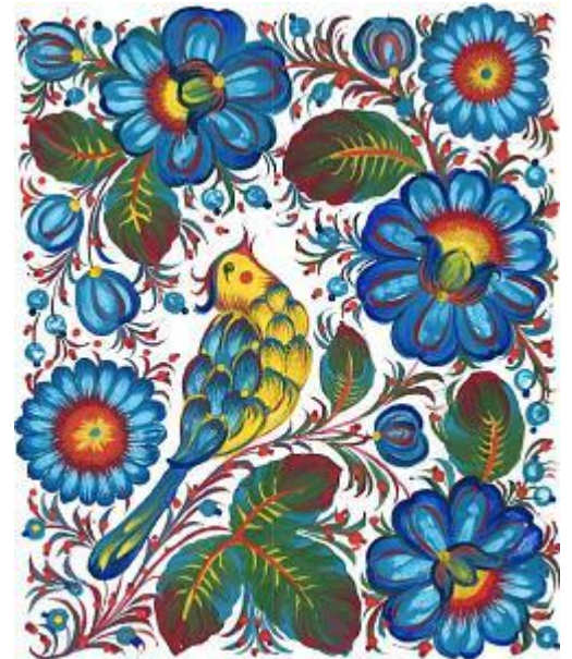
Petrykivka maalingu näide