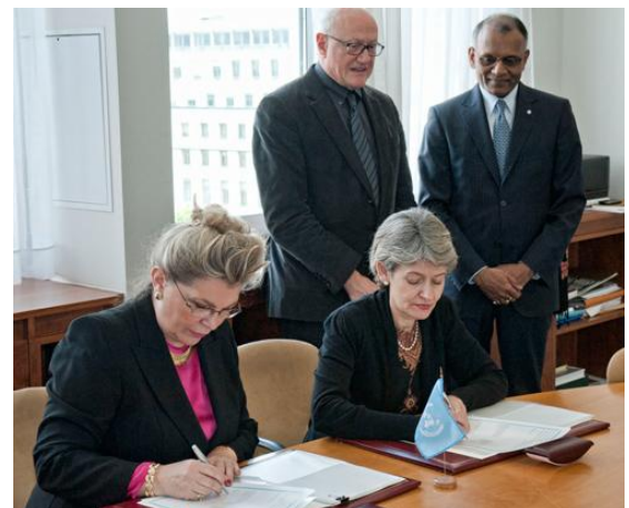
UNESCO peadirektor Irina Bokova ja peakonverentsi president Katalin Bogyay allkirjastavad ajaloolist linnamaastikku käsitleva soovitude 7. mail 2012.

2011. aastal UNESCOs vastu võetud dokumendi valmimisele on kaasa aidanud maailmapärandi komitee Eesti delegatsiooni liikmed nii kirjalike kommentaaride kui ka ekspertkohtumistel osalemisega.