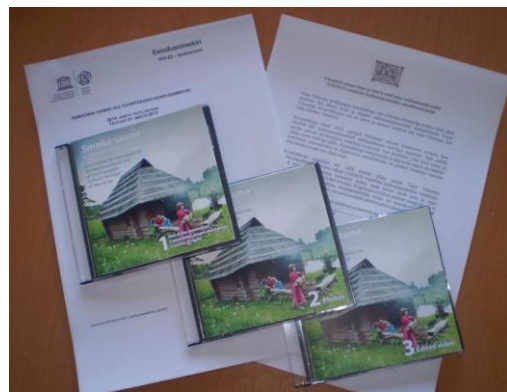
Taotluse tekst, fotod ja video

2013. aasta märtsi seisuga on UNESCO vaimse kultuuripärandi esindusnimekirjas 257 kultuurinähtust, millest kolm pärineb Eestist: Kihnu kultuuriruum, Eesti, Läti ja Leedu laulu- ja tantsupidude traditsioon ning Seto leelo.