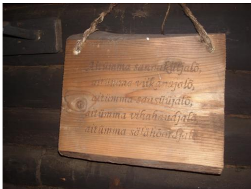
Saunasõnad on osa saunakombestikust.

Edasiste tegevusplaanide hulka kuulub ka suitsusaunatava laiem teadvustamine UNESCO vaimse kultuuripärandi nimekirja kaudu. Taotluse esitamise tähtaeg on 31. 03 2013.