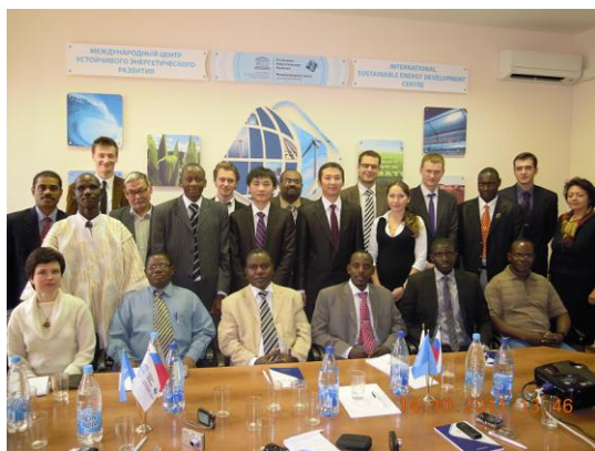
UNESCO/ISEDC koolitusel osalejad Moskvas

Programmis osalesid Valgevene, Burkina Faso, Hiina, Eesti, Gambia, Ungari, Kasahstani, Kõrgõzstani, Mali, Mosambiigi, Senegali, Sri Lanka ja Sudaani esindajad. Osalejad esinesid ettekannetega taastuvenergia allikate arendamise perspektiivist oma riikides. Saadud teadmisi kasutatakse edaspidi teadustegevuses ja praktikas.