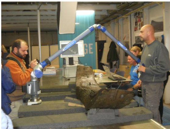
Antwerpeni koge töötoas käib konserveerimine

Eesti esindajana osales teaduslikul kollokviumil Maili Roio muinsuskaitseametist. Tema osalemist toetas Euroopa Sotsiaalfond ja rahvusvaheline programm DoRa.